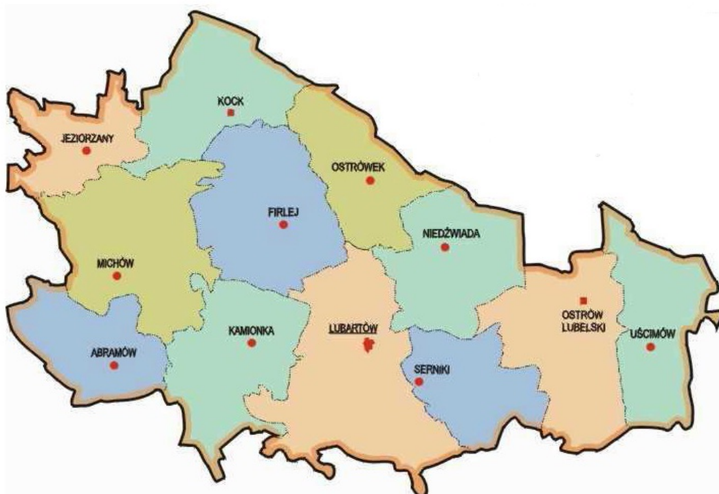
Ryc. Mapa Powiatu Lubartowskiego.

Gmina Firlej zajmuje powierzchnię 126,5 km 2 , ma kształt owalny. Sieć osadnicza liczy 20 sołectw i miejscowości. Gmina znajduje się w środkowej części powiatu lubartowskiego, zajmuje 9,8 % jego powierzchni oraz obejmuje ok. 6,8 % ludności powiatu. Stanowi 0,5 % powierzchni województwa lubelskiego oraz 0,3% ludności województwa. Pod względem gęstości zaludnienia należy do obszarów o najniższych wskaźnikach; średni wskaźnik zaludnienia w gminie wynosi 47 osób na km 2 , średni wskaźnik dla powiatu – 70 osób km 2 na, a dla województwa 86 osób na km 2 .